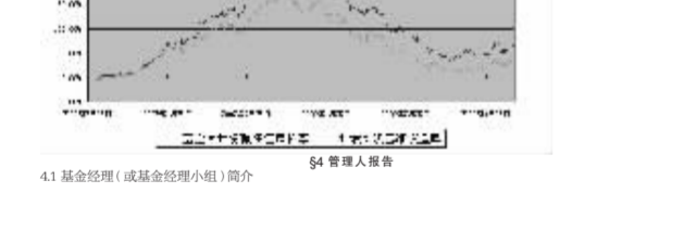
基金累计净值增长率与同期业绩比较基准收益率对比图

3.2.1 本报告期基金份额净值增长率及其与同期业绩比较基准收益率的比较 3.2.2 本基金合同生效以来基金累计份额净值增长率变动及其与同期业绩比较基准收益率变动的比较